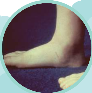
圖 1: 足部內側縱弓的角度減少

正常的足部有：內縱足弓、外縱足弓和橫弓，行走的過程中，內縱足弓有吸震的作用。所謂扁平足是指當負重站立時，內側縱弓的角度減少(圖 1)、甚至出現扁平及無足弓，前足部外展及後足部(跟骨)外翻(圖 2)，以腳趾頭負重站立時則呈現出足弓(圖 3)。