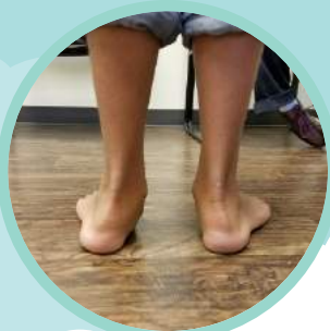
圖 2: 後足部外翻