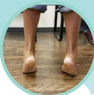
圖 3: 以腳趾頭負重站立時則呈現出足弓