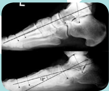
圖 4: 足弓角度正常與減少

扁平足的發生率在成年人約有 20% 至 25%，在兒童則沒有確切的統計數據，扁平足在生理解剖構造上，常見有韌帶鬆弛的體質，其中約 25% 合併有腓腸肌及比目魚肌肌腱攣縮。臨床上會透過 X 光影像學檢查足弓角度(圖 4)、有無距骨聯黏融合、先天性垂直距狀骨及附生性舟狀骨的存在來輔助診斷。